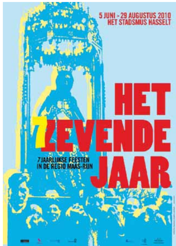
■ Affiche van de tentoonstelling 'Het zevende jaar' die in 2010 in het Stadsmus te Hasselt liep naar aanleiding van de zevenjarige Virga Jessefeesten.

Vermeldenswaardig in Vlaanderen is het onderzoek van Noel B. Salazar omtrent de relaties tussen immaterieel erfgoed en toerisme. Sinds de komst van de Inventaris Vlaanderen staan wel een aantal nieuwe onderzoeksinitiatieven op stapel die de eerstkomende jaren resultaten zullen opleveren. 19