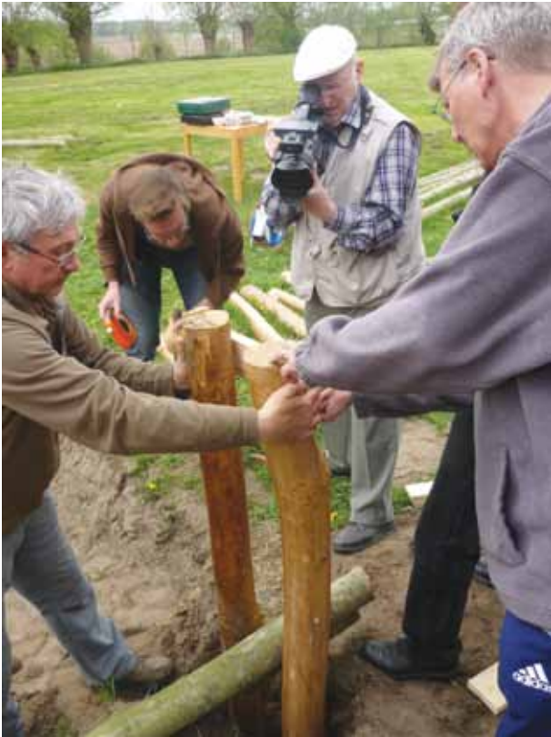
■ Aanleg van een krulbolbaan