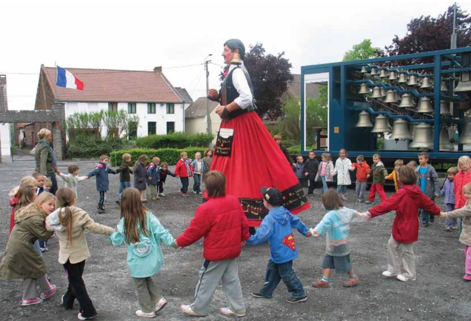
■ Kinderen dansend met reus op de klank van de mobiele beiaard.