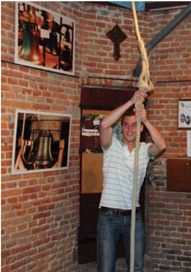
■ Laat de klokken luiden – Roeselaarse Klokkengilde