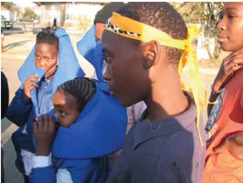
■ Capacity building workshop rond ICE met jongeren in Zuid-Afrika.

Maar het is ook belangrijk om straks een stap verder te zetten en de energie en expertise van dit cultureel-erfgoedveld én van deze levendige elementen te bewegen naar fenomenen die wankeler zijn of minder makkelijk de weg vinden. Het zou dan kunnen gaan om ICE dat minder sterk georganiseerd is, geen krachtige structuren of verenigingen achter zich heeft, minder lokale politieke of toeristische respons krijgt, misschien minder goed 'in de markt' ligt ... Mogelijks is de inzet van erfgoedwerkers in de nabije toekomst meer aangewezen daar waar de nood hoog is, het bijna te laat is en er minder spontaan of volledig aan overdracht en borging wordt gedaan. Door impul-