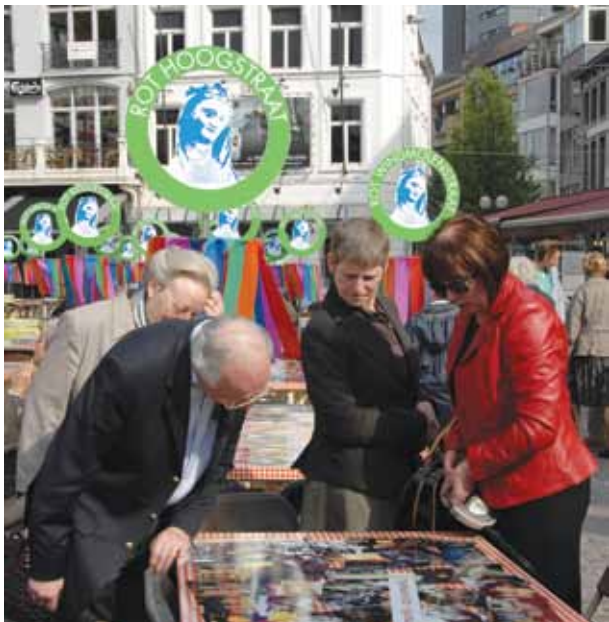
■ Aftrap voor de rottenwerking van de Virga Jesse op Erfgoeddag 2009.