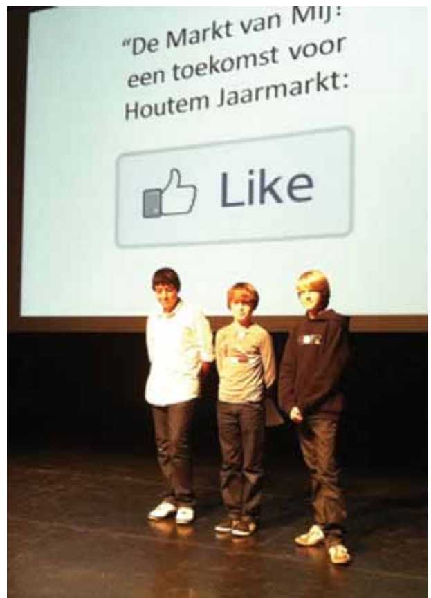
■ Educatief blogproject Houtem Jaarmarkt Foto: Nele Buys, 2012