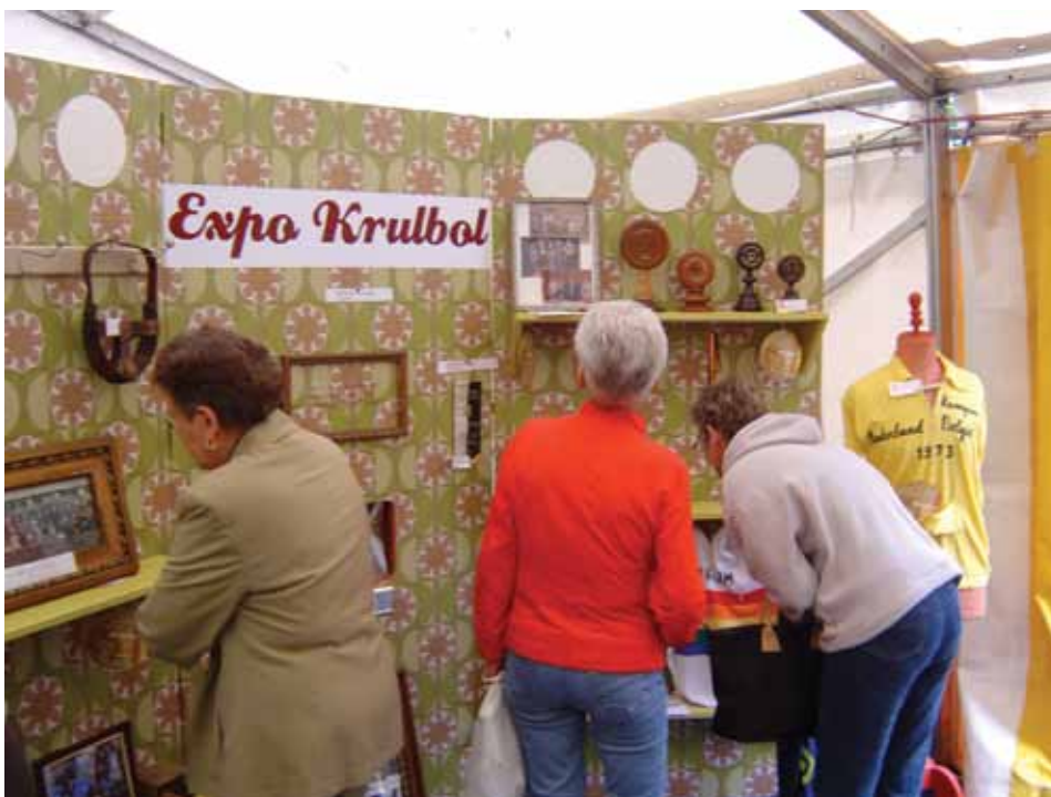
■ Participatieve inzamelingsactie rond het ICE van de krulbolsport

Het wordt snel duidelijk dat er 1001 uitdagingen en mogelijkheden voor borging zijn. Om niet zomaar wat te beginnen, is het slim om even tijd en afstand te nemen, vooruit te denken en een plan te maken. Dit hoeft en mag geen zware belasting vormen voor de actieve erfgoedgemeenschappen. Terecht wordt immers wel eens opgemerkt dat men al genoeg om handen heeft met het in stand houden en beoefenen van alles wat bij de levende cultuuruitingen komt kijken: buurtvergaderingen, repetities, decorbouw, communicatieplannen, fondsenwerving, milieuvergunningen, veiligheidscoördinatie ... Voor het overgrote deel gaat het om vrijwilligers en verenigingen die zich in hun vrije uren inzetten voor maatschappelijk waardevolle en dikwijls gemeenschapsvormende activiteiten die met het ICE gerelateerd zijn. Een kleiner maar niet minder belangrijk aantal dragers van ICE - bv. ambachtsslui of podiumkunstenaars - zetten zich in vaak moeilijke economische ►