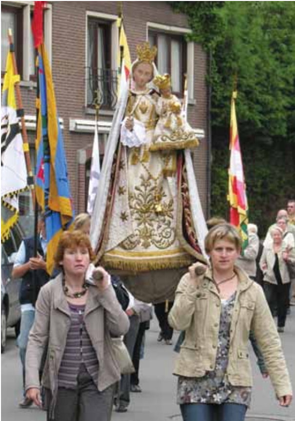
■ Processie met een Mariabeeld.