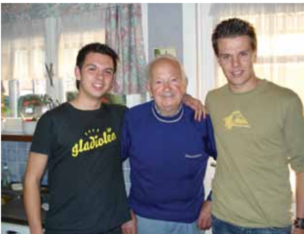
■ Tussen de Mensen – project Geelse gezinsverpleging

vrijwilligers zette zich hiervoor in. Ook de leerlingen van twee Geelse scholen werden ingeschakeld om mensen te bevragen. In totaal werden 150 getuigen geïnterviewd. www.tussendemensen.be