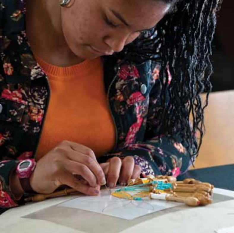
■ Design met Wortels: leren kantklossen. Foto: Alain Meessen (www.fotoplezier.be) – Fotohuis Brugge (www.fotohuis.be), 2012