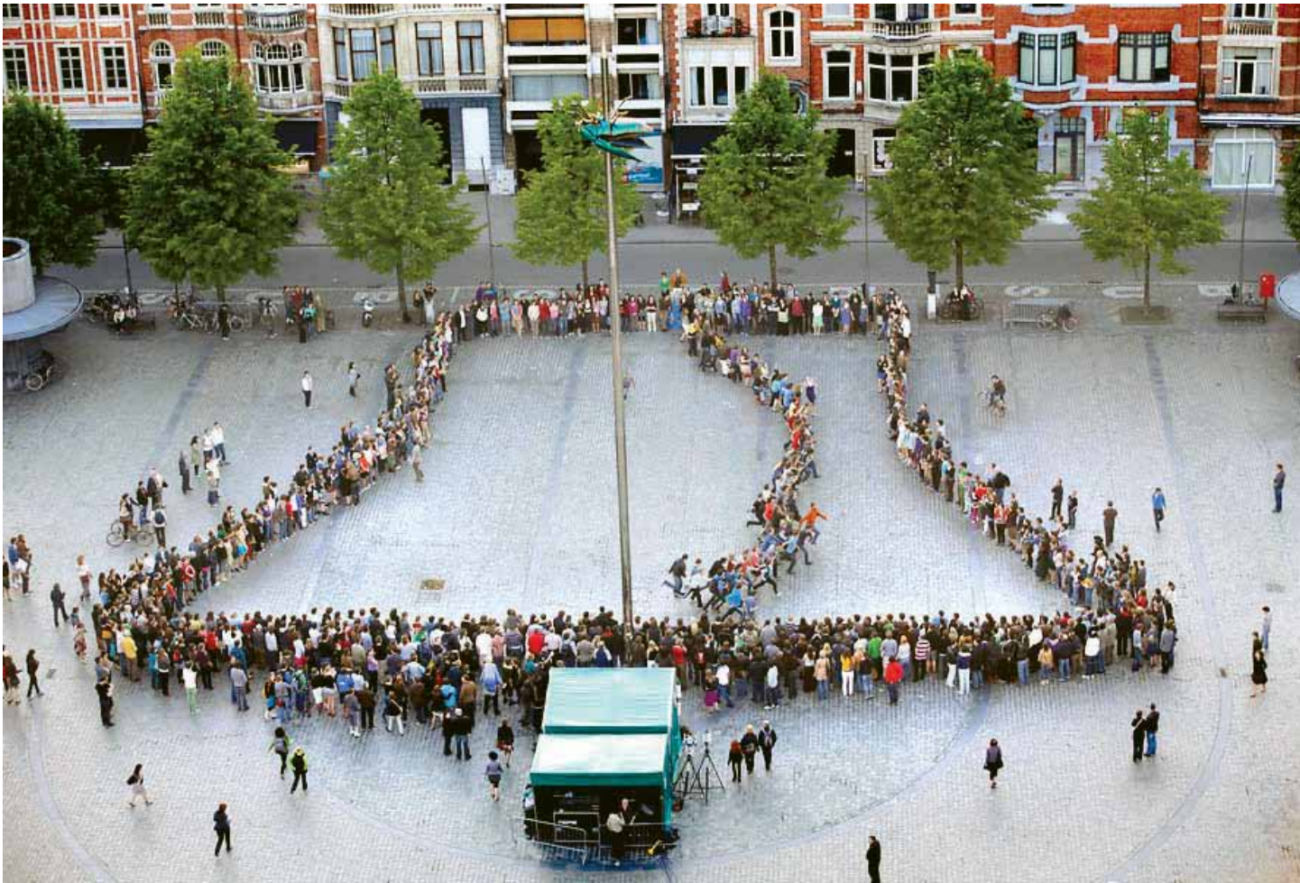
■ Levende klok. Sensibilisering voor de beiaardcultuur in Vlaanderen

is als ICE en een andere niet. Het gevaar bestaat ook dat het levende erfgoed om een of andere reden wordt 'bevroren' in een bepaalde vorm/van een bepaald moment – bv. door folklorisering of als gevolg van het prat gaan op een bepaalde 'authenticiteit'. In dergelijke gevallen neemt de economische waarde de overhand op de sociale waarde. 25